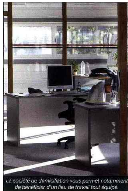
La société de domiciliation vous permet notamment de bénéficier d'un lieu de travail tout équipé.

Outre la garantie d'une façade prestigieuse, pour certaines adresses, la société de domiciliation d'entreprise vous fournit également un espace d'activité mettant à disposition ordinateurs, Internet, imprimantes, fax, téléphones... Cette structure vous permet notamment de bénéficier d'un lieu de travail tout équipé, mais également de bureaux pour recevoir vos clients et partenaires. Parmi les diverses sociétés qui proposent des services de bureau virtuel, Servcorp assure une gamme variée d'offres pour les entrepreneurs. De l'accueil au standard téléphonique,